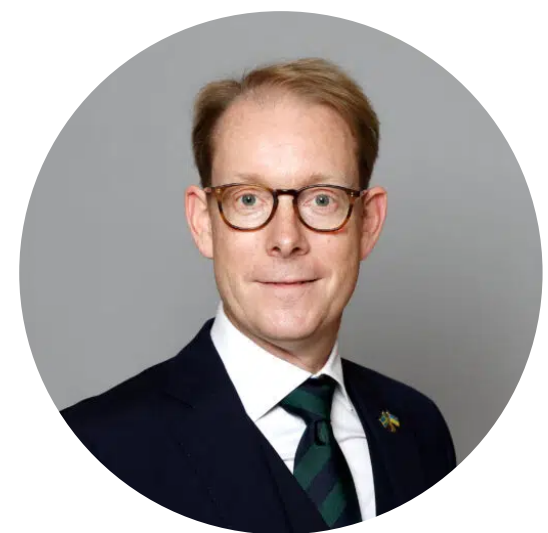
Tobias Billström, Årsmötetalare